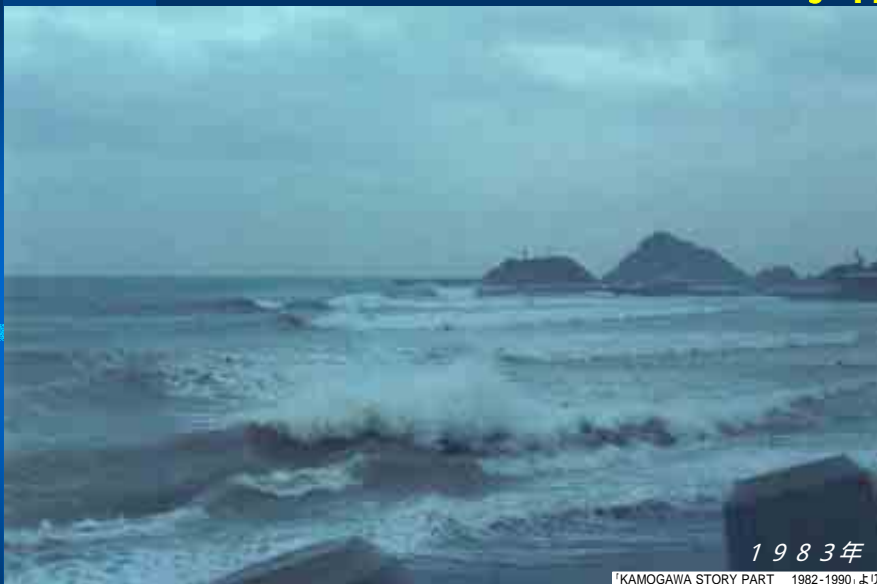
1983年 KAMOGAWA STORY PART 1982-1990「より