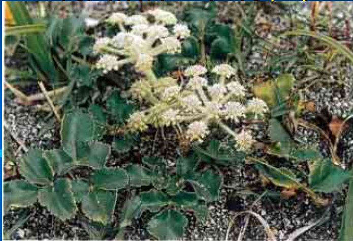
図5-106 ハマボウフウ(セリ科) 砂浜に光沢のある厚い葉を広げ複散形状に小形の白花をつける 1998年5月31日 和田町海発