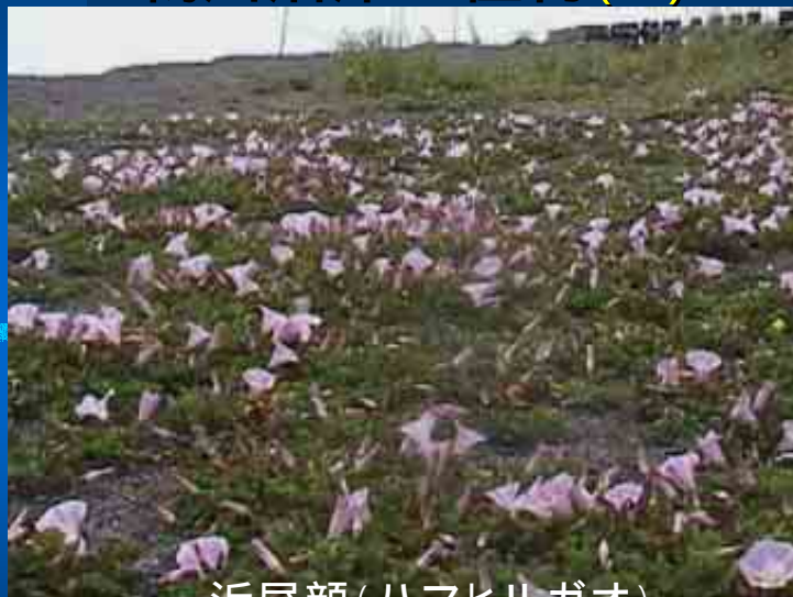
浜昼顔(ハマヒルガオ)