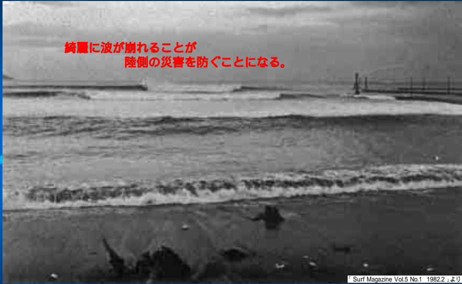
Surf Magazine Vol.5 No.1 1982.2「より