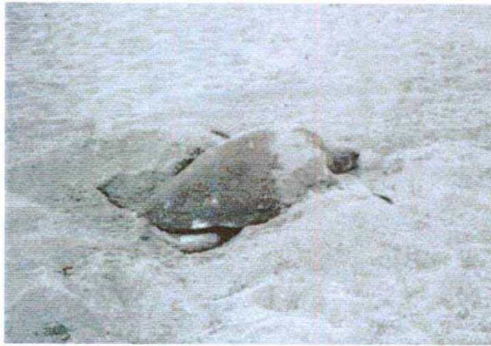
産卵中のアカウミガメ (平成6年7月撮影)

日本でのアカウミガメの産卵は、福島県や茨城県でも確認されているが、産卵とふ化が毎年認められる産卵場としては、千葉県が北限。