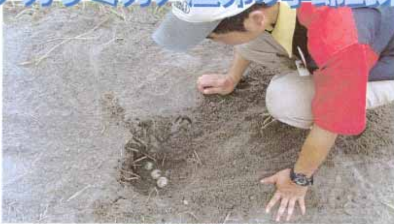
砂浜に産みつけられたアカウミガメの卵 卵は直径4cmほどで、一卵の産卵量は約40個。産卵のおそれがあるため、卵を改めて施設に移し保護されている。