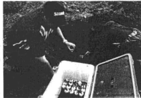
卵を掘り起こすシーワールド職員＝鴨川・東条海岸で

東条海岸は、美しい砂浜が、6月15日、毎年6月から8月にかけてアカウミガメの産卵が確認される。しかし、河口や波打ち際に近い場所では産卵が行われ、台風などにより孵化前の卵が流されるケースもある。シーワールドでは、孵化に遅くない場所の卵を、施設内に運び、繁殖展示施設（相模の浜）に移し、孵化した子ガメを海に放流する取り組みを継続している。今年に入ってから現在までに、同海岸で確認された産卵はるか所、このうち特