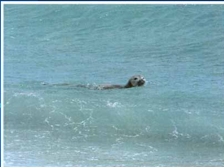
波打ち際で泳ぐアザラシ