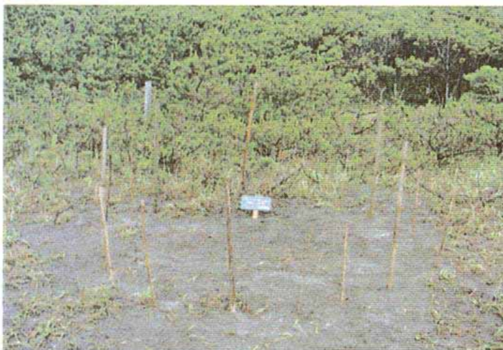
ウミガメ産卵場所の保護

産卵後、約2ヶ月で子ガメが誕生する。係員が毎日砂の中の温度を測定し、ふ化を見守る (卵の発育温度は24℃～32℃)。