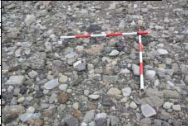
g 横渚橋（堰）下流付近の土砂