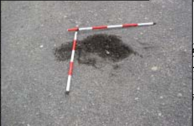
e 権現橋上流付近の土砂