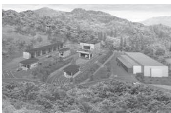
中継施設イメージ図

以上のことから、通常市の市からの発注形態とは全く異なるもので、本市が直接かかわれるものではない。