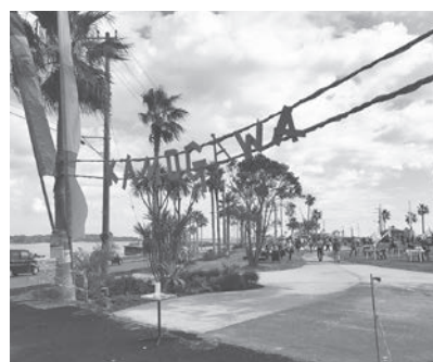
「オータムフェスタ2020」会場

答 市民向けに40000セット、観光客向けに10000セットを発行・販売し、全て完売となっている。観光客と市民向けの区別はできないが、11月6日現在で973万2000円、約65%の使用が確認されている。