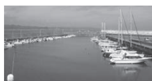
鴨川フィッシャリーナ

問 市と漁協が力を合わせ、事業展開すべきでは。 答 漁協と一つになり活性化していく。市民の皆さんとも話していきたい。