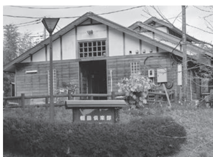
地域資源総合管理施設「棚田倶楽部」

のであるため、今後の施設のあり方や将来的な施設譲渡を含めた新たな管理の手法を検討する期間として3年間としたものである。