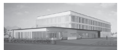
新国保病院イメージ図

整備する。これらの取り組みを進め、健康長寿日本一を目指し、本市のイメージアップに努める。