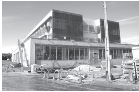
新国保病院の工事が進められている

場において、新型コロナウイルス感染者が確認されたことに伴う工事の一時中断による新病院開院スケジュールへの影響を懸念し、このような条例案としたもので、今後、開院の日が明らかになり次第、開院予定日を施行期日とする本条例の一部改正議案を改めて提出したいと考えている。