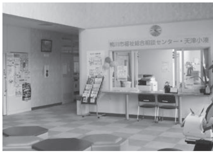
福祉総合相談センター・天津小湊

受託事業者については、活動実績のある社会福祉法人4事業者を選定し、プロポーザル方式により決定している。