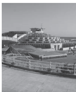
鴨川オーシャンパーク

今後は、イベント企画による集客や観光関連団体との連携による事業展開を検討、計画していく。