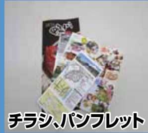
チラシ、パンフレット