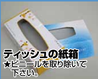
ティッシュの紙箱 ★ビニールを取り除いて下さい。