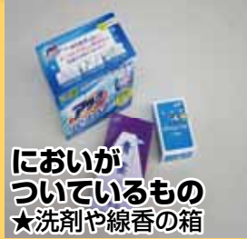
においがついているもの ★洗剤や線香の箱