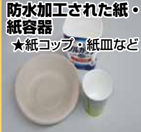
防水加工された紙・紙容器 ★紙コップ・紙皿など