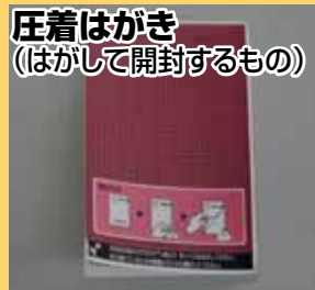
圧着はがき (はがして開封するもの)