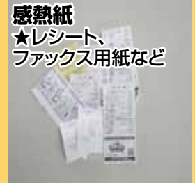
感熱紙 ★レシート、ファックス用紙など