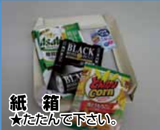
紙箱 ★たたくて下さい。

注意: 「雑がみ」以外の付着物(プラスチック、ビニール、テープなど)を取り除いて下さい。