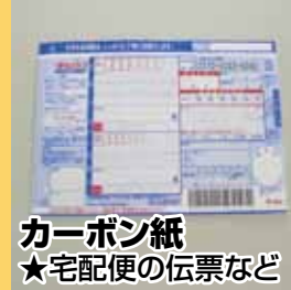
カーボン紙 ★宅配便の伝票など