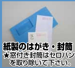
紙製のはがき・封筒 ★窓付き封筒はセロハンを取り除いて下さい。