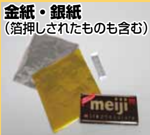
金紙・銀紙 (箔押しされたものも含む)