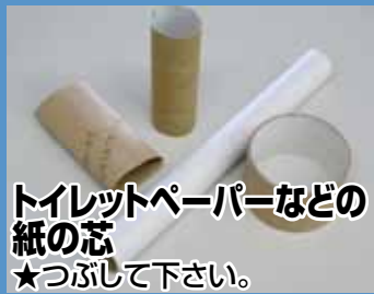
トイレトペーパーなどの紙の芯 ★つぶして下さい。