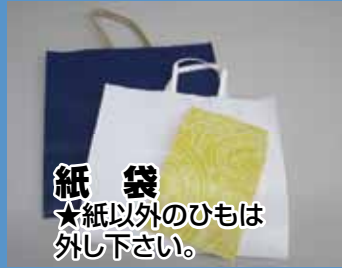
紙袋 ★紙以外のひもは外して下さい。