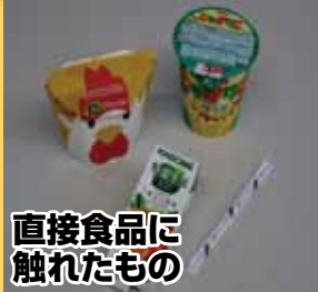
直接食品に触れたもの