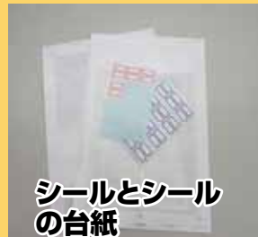
シールとシールの台紙

紙マークがついていても、アルミ加工されているなど「雑がみ」として出せないものがありますので注意しましょう。