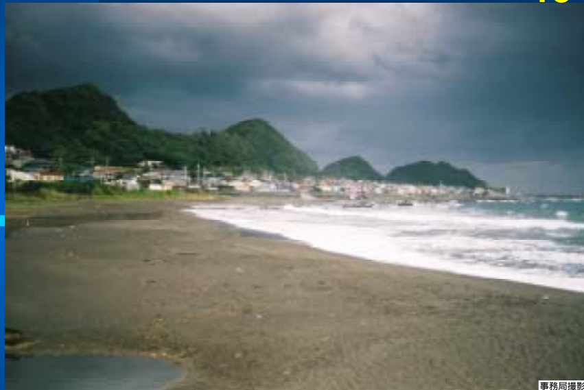
写真246 同上: 波の打ち上げによる堆砂によってバームが形成され閉塞が進む 河口 (前方は海岸北端部を仕切る葛ヶ崎の岩礁海岸と浜荻漁港)