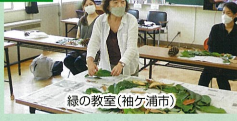
緑の教室(袖ヶ浦市)