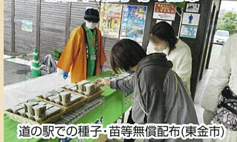
道の駅での種子・苗等無償配布(東金市)