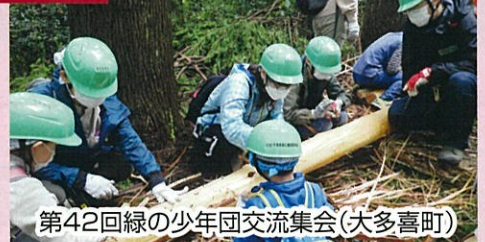
第42回緑の少年団交流集会(大多喜町)