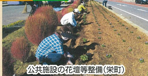
公共施設の花壇等整備(栄町)