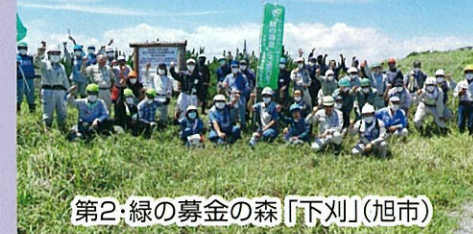
第2・緑の募金の森「下刈」(旭市)