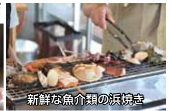
新鮮な魚介類の浜焼き