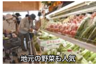
地元の野菜も人気

4月27日のオープン初日には、市内外から多くの皆さんが来場。曾呂産の甘夏を使ったスイーツや地元青果店のスムージーを味わうなど、賑わいを見せていました。