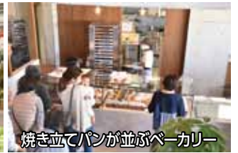
焼き立てパンが並びベーカリー