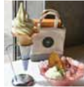
「シトラス&チーズ」が コンセプトのスイーツ