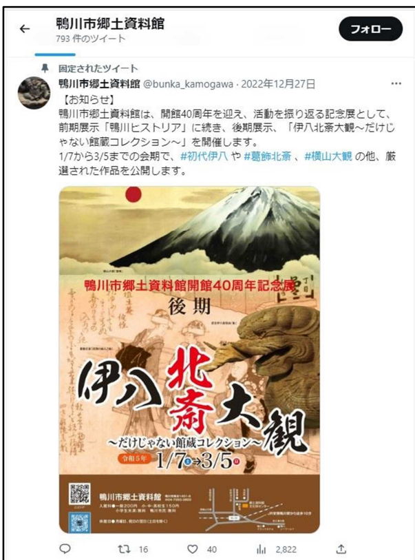
展覧会開催のお知らせ