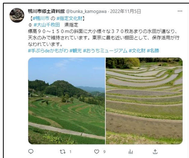
市内文化財の紹介