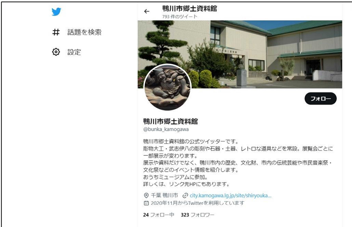
公式 Twitter のホーム画面