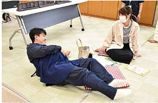
臨月のお腹の大きさと同様の重り(8.5kg)を付けて妊婦体験をするパパ

ふれあいセンターでは、妊娠5カ月～8カ月の妊婦やその家族を対象に、パパの妊婦体験や沐浴演習、育児アドバイスなどを行っています。