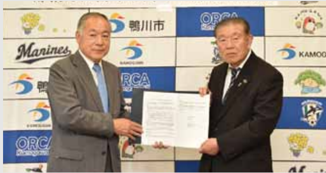
房日新聞社 片方代表取締役(左)と 鴨川市長

片方代表取締役は「有事の際には、市と連携しながら、積極的に紙面や電子版に情報を掲載していきたい」とコメントしました。