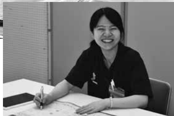
▲令和5年採用 都市建設課 技師

▷昭和58年4月2日以降に生まれた方で、保健師の資格がある方、または令和6年3月31日までに資格取得見込みがある方