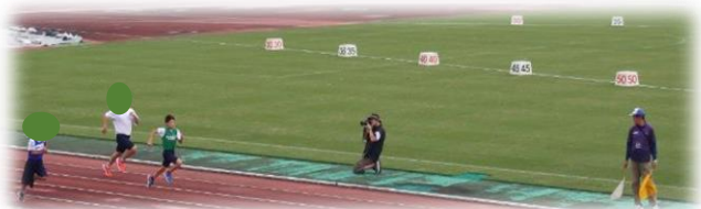
次の走者にバトンをつなぐ!!