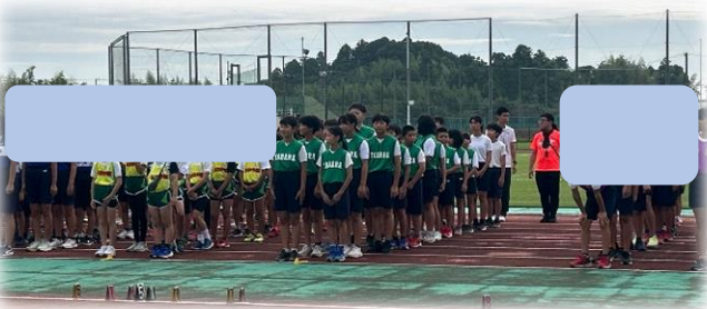
開会式!リーダーを先頭にして整列する選手!!

記録会当日は、陸上練習のリーダーである さんと さんを中心として、仲間の競技をスタンドから応援する姿がとても立派でした。放課後練習をがんばった選手の皆さん、お疲れさまでした。