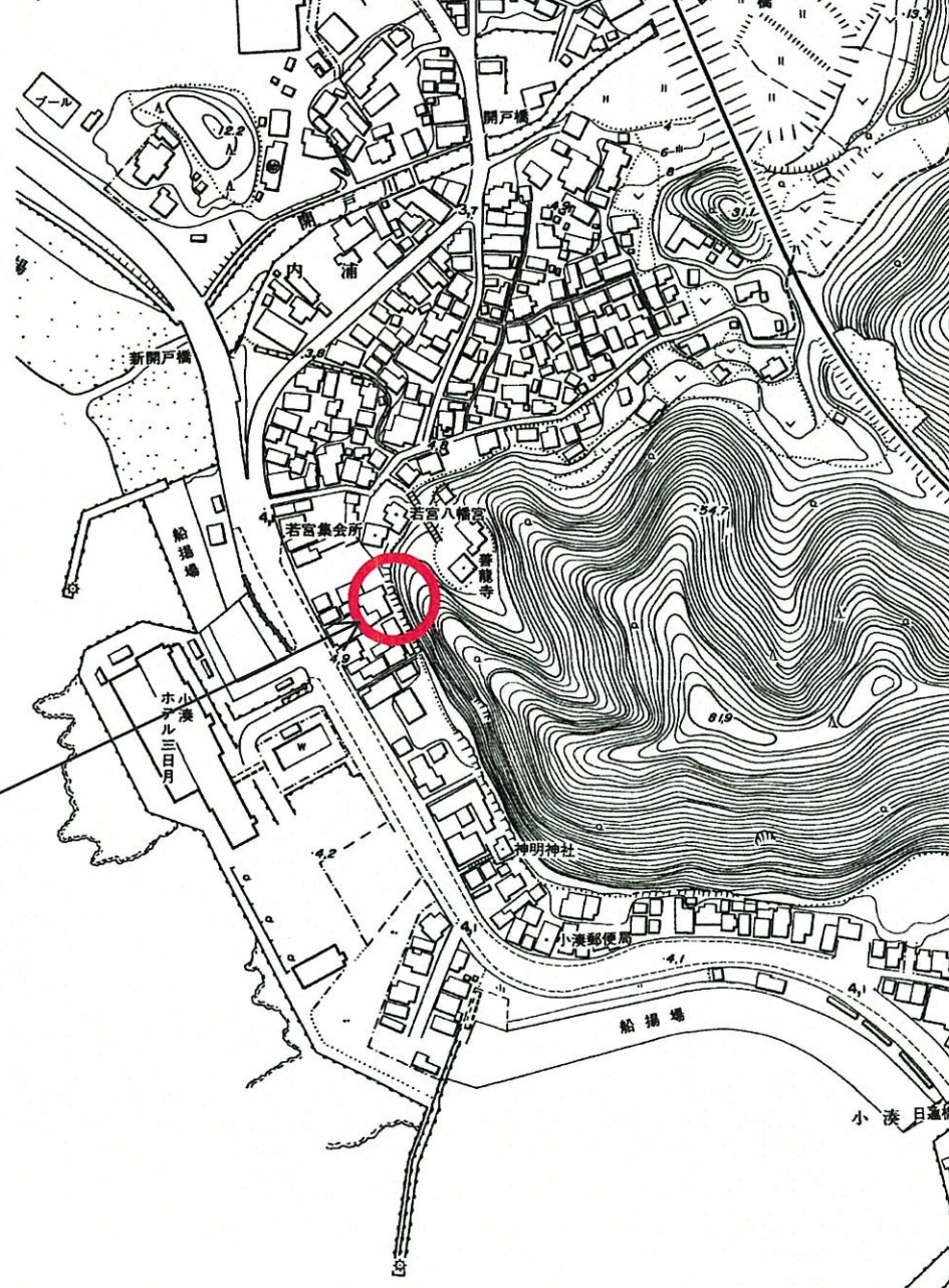
平面図 S=1 : 5,000