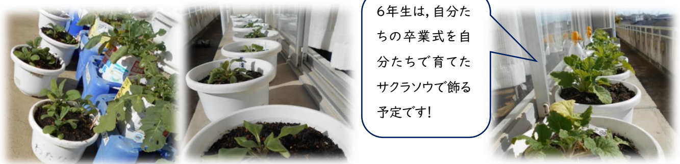
日当たりのよいベランダに並ぶ苗

これから寒さが厳しくなりますが、自分の鉢に植えた苗を大事に大事に育てていきます。きれいな花が咲いた時の喜びは大きいでしょうね。