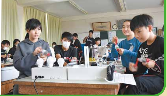
手回し発電機で電球を点灯

講師が「今日覚えたことを家の人にも話して、お家でも実践してください」と話すと、子どもたちは大きな声で「はい!」と答えていました。