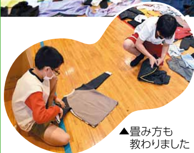
▲畳み方も 教わりました

6月に市内の板橋区立天津わかしお学校で行われた「届けよう、服のチカラ」プロジェクトの出張授業後、9月から回収活動を本格的に開始し、11月28日(火)に回収後の報告会が開かれました。