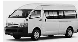
▲車両はマイクロバスに変更

市では、交通事業者と協議などを行い、持続可能で有効な公共交通網への再編に取り組んでいます。その一環として市コミュニティバスは、令和6年4月から、鴨川地域は運行区間などを再編して「循環線」に、江見地域・天津小湊地域は「チョイソコかもがわ(実証運行)」に転換します。なお、長狭地域で実証運行中の「チョイソコかもがわ」は、運行計画を変更した上、実証運行期間を1年間延長します。