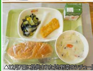
△12月7日に提供された「冬野菜のシチュー」