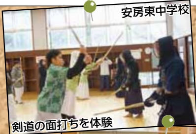
剣道の面打ちを体験

インドネシアの生徒たちは、2月8日(木)に安房東中学校を訪れ剣道部を、20日(火)に鴨川中学校を訪れ剣道部と柔道部をそれぞれ見学し、部員に教わりながら、面打ちや投げ技を体験。言葉が分からなくても、お互いに身振り手振りでコミュニケーションを取るなどして交流を深めていました。その後、インドネシアの生徒たちは、体験のお礼としてインドネシアの伝統的な歌や踊りを披露。見ていた生徒たちは、手拍子や拍手で盛り上げました。市内の中学生たちは「楽しかった。また来年も来てほしい。」と話していました。