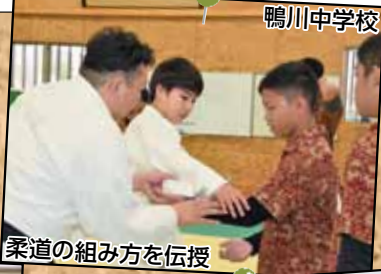
柔道の組み方を伝授