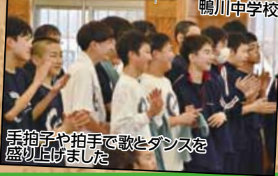
手拍子や拍手で歌とダンスを盛り上げました