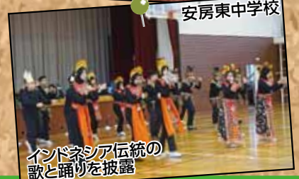
インドネシア伝統の歌と踊りを披露