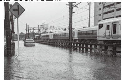
▲令和5年9月8日の台風被害