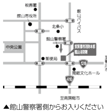
▲館山警察署側からお入りください

安房郡市消防本部・館山消防署(館山市北条686-1)の北側に建設を進めていた、合同庁舎への進入路が完成しました。