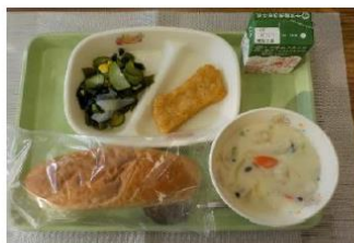
12月7日 「冬野菜のシチュー」