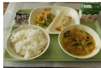
12月15日 「トンコツスープ」