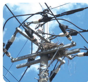
カラスの巣がある