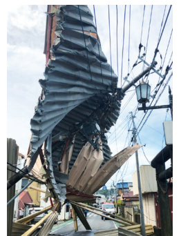
2019年台風15号襲来時の実際の被害の様子

切れた電線や電柱・電線に引っかかっているビニールや樹木等を 発見された場合は、東京電力パワーグリッドまでご連絡ください