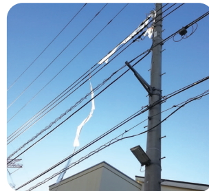
電線にビニールが 引っかかっている