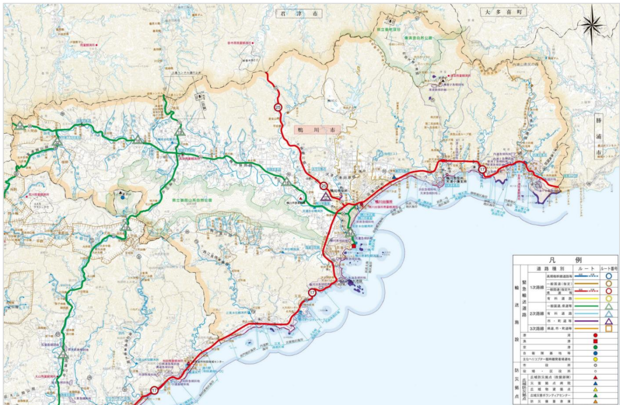
資料:千葉県緊急輸送ネットワーク図(令和3年3月)