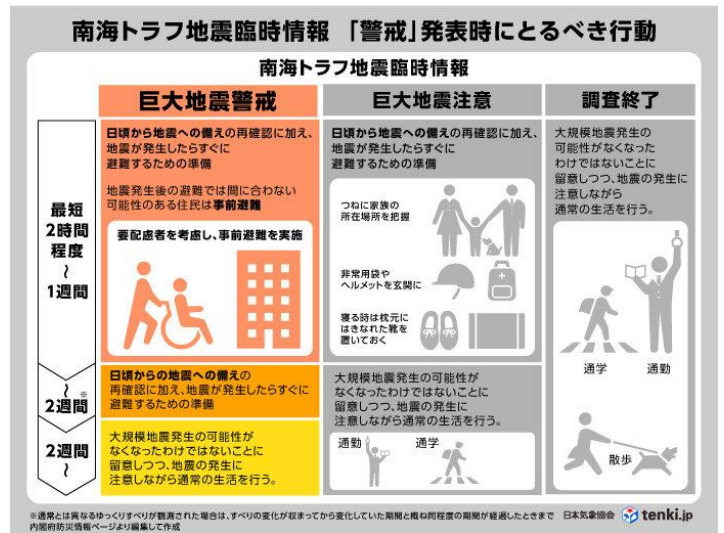
南海トラフ地震臨時情報発表時の行動（気象庁）

南海トラフ巨大地震が発生する可能性があるときは南海トラフ地震臨時情報が発表され、皆さまに伝達しますので、地震、津波に備えた行動をとりましょう。