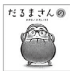
▲かがくいひろし/作 (プロズ新社)