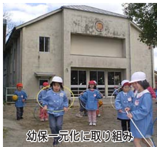
幼保一元化に取り組み