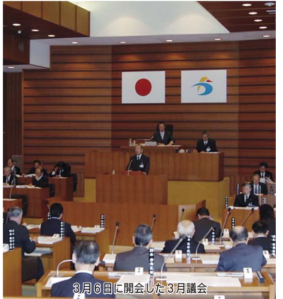
3月6日に開会した3月議会