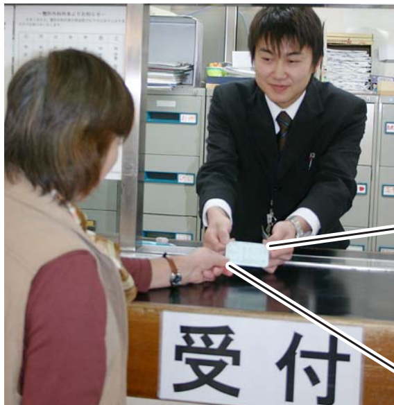
キャッシュカードや定期券と同じサイズになります

●編集発行・鴨川市総務部市長公室 広報広聴係 ●電話・04(7093)7827 ●FAX・04(7093)7850 ●住所・〒296-8601 鴨川市横渚1450 ●ホームページ http://www.city.kamogawa.lg.jp/