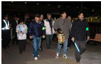
防犯ボランティアによるパトロール

●編集発行・鴨川市総務部市長公室 広報広聴係 ●電話・04(7093)7827 ●FAX・04(7093)7850 ●住所・〒296-8601 鴨川市横渚1450 ●ホームページ http://www.city.kamogawa.lg.jp/