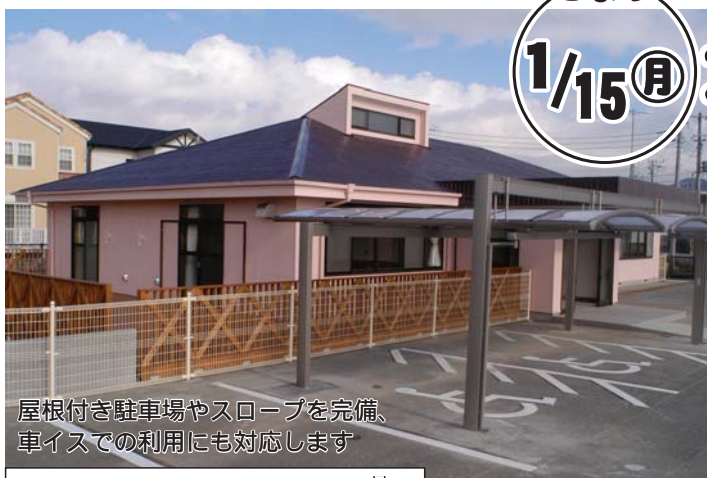
屋根付き駐車場やスロープを完備、車イスでの利用にも対応します