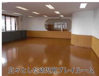
広々とした幼児用プレイルーム

「子育て総合支援センター」の利用対象は、就学前児童と障害児、保護者の皆さんです。センターの開所日は、月・火・金・日曜日の週5日間。利用時間も拡大し、午前9時30分から午後3時30分までとなります。施設内では、子育ての専門家や保健師、栄養士による全般的な育児相談、子育てサークルの育成、勉強会、情報提供などを通して、