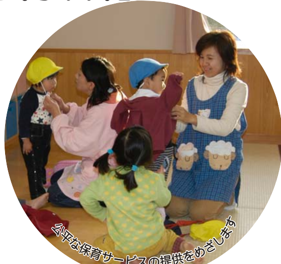
公平な保育サービスの提供をめざします

市内8か所の保育園で行っている「延長保育サービス」が、来年4月から有料化になります。これは、利用時間に応じた保育料を負担いただくことで、サービスの格差を解消しようというものです。延長保育料は、1か月の利用時間に単価(1時間100円)をかけて算出します。なお、午後4時から5時まで(平日)と、正午から1時まで(土曜日)は「時間外保育」とし、保育料はいただきません。