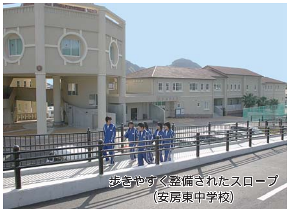
歩きやすく整備されたスロープ (安房東中学校)

市民皆さんに納めていただいた税金などがどのように使われたのか。市では条例に基づき、財政事情を年2回公表しています。今回は、平成17年度の決算状況と平成18年度予算の進みぐあい（4月1日～9月30日）についてお知らせします。