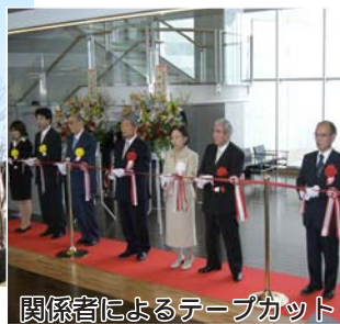
関係者によるテープカット