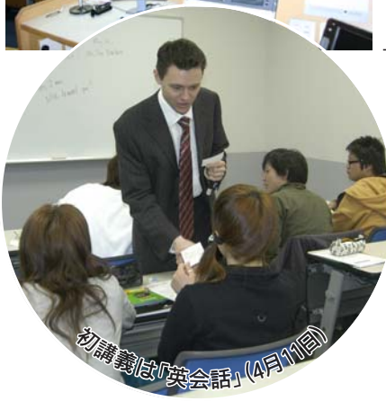
初講義は「英会話」(4月11日)