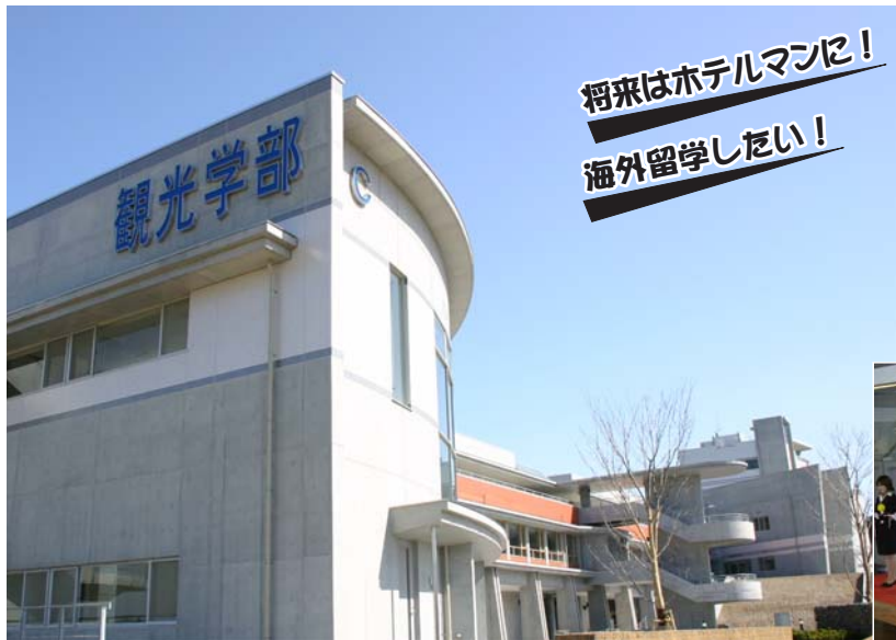
3月23日に竣工した「観光学部」校舎

●編集発行・鴨川市総務部市長公室 広報広聴係 ●電話・04(7093)7827 ●FAX・04(7093)7850 ●住所・〒296-8601 鴨川市横渚1450 ●ホームページ http://www.city.kamogawa.lg.jp/