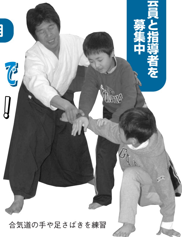
合気道の手や足さばきを練習

総合型地域スポーツクラブ「鴨川オーシャンスポーツクラブ」では、新年度の会員を募集しています。このクラブは、市内全域の子どもから大人までを対象にした新しいタイプのスポーツクラブ。自分に合った健康・体づくりはもちろん、世代の枠を越えた交流を楽しむことができます。 定期的に活動している種目は、サッカー、ソフトテニス、バレーボール、バスケットボール、卓球、バドミントン、ボクシング（ボクササイズ）、健康スポーツ、合気道の全9種目で、市内の体育館やグラウンドを会