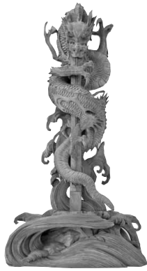
大山寺俱利伽羅竜