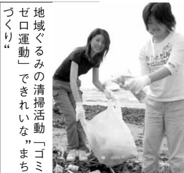
地域ぐるみの清掃活動「ゴミゼロ運動」できれいな「まちづくり」。