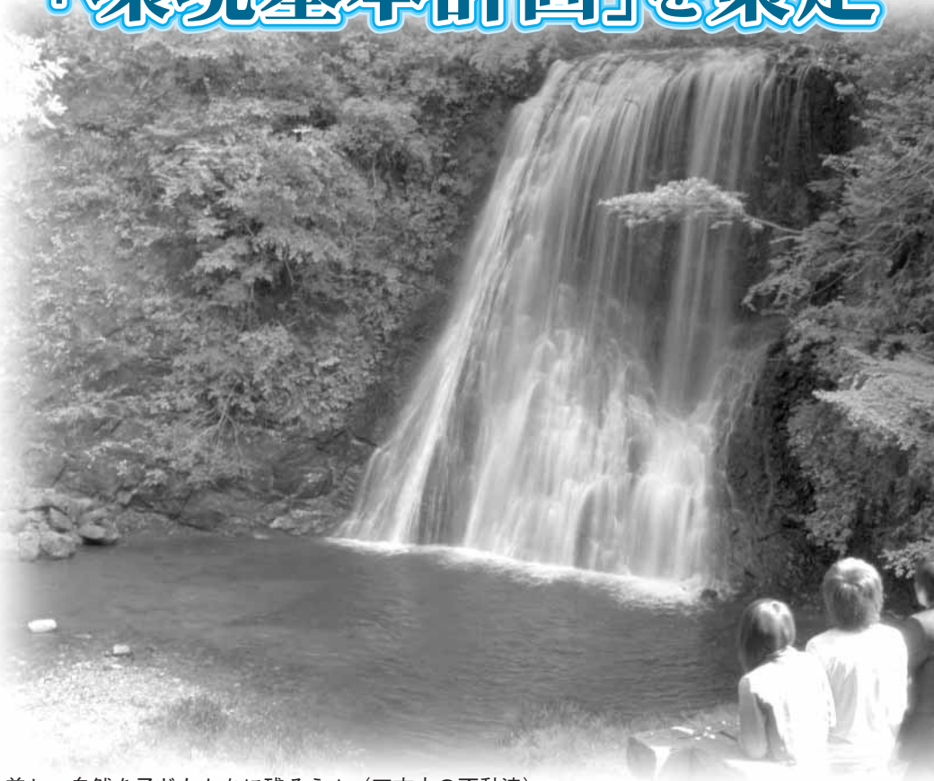
美しい自然を子どもたちに残そう！（四方木の不動滝）

市では、「豊かな自然を守り育て、地球環境の保全に貢献するまち」を望ましい環境像とする「鴨川市環境基本計画」を策定しました。この計画は、市民皆さんが、健康で快適・安全に暮らせるように、環境問題や環境保全などに関する基本方針を定めたものです。計画の柱には、環境像の実現に向けた「6つの基本目標」と「5つの重点プロジェクト」などが盛り込まれ、市民皆さんには、身近にできる活動としてリサイクルの推進やマイバックの持参などの取り組みが求められています。どうぞ、行政・市民・事業者など地域ぐるみで「ふるさと鴨川」の環境づくりを協力ください。