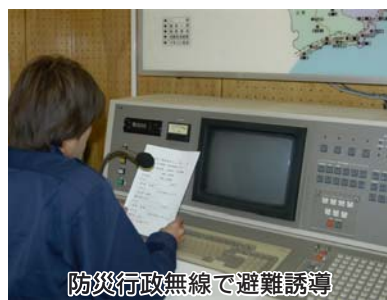
防災行政無線で避難誘導

緊急時の被害を最小限に。市では国の法律に基づき、「国民保護計画」を策定しました。この計画は、武力攻撃や大規模テロなどから市民皆さんの生命・財産を守るための基本方針で、緊急事態に対する日ごろの備えと予防（万が一のときの国・県・市の役割分担などが盛り込まれています。このうち市の役割は、住