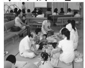
キッズスペースもあり