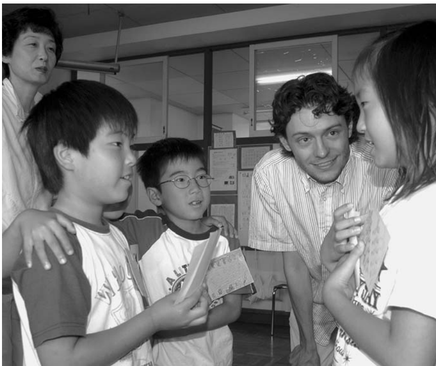
日常会話やゲーム、歌などでお友だちと交流

小中一貫教育を推進している市では、来年4月から市内全小学校の1年生から英語活動を行います。これは、英語のあいさつや会話などを通じてコミュニケーション能力を養おうというものです。平成20年3月に文部科学省が示した学習指導要領の改訂では、小学校5・6年生から英語活動が必修授業となりました。これに先駆け市では、市内全小学校の1年生から英語活動に取り組んでいきます。