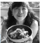
「ひとりでもできるもん」 「はなまるマーケット」 など多数出演

※そのほか楽しい内容が盛りだくさん!!詳しくは健康推進課(☎7093)7111へ