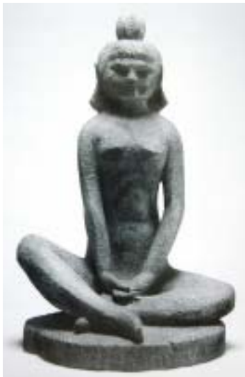
じょうち 「浄池」1961年(昭和36年) 高さ94cm クスノキ