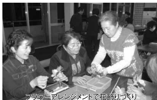
フラワーアレンジメントで花飾りづくり

▶ 受付期間は、5月15日(木)まで。受付時間は午前9時から午後4時までです(5月5日、12日は休館)