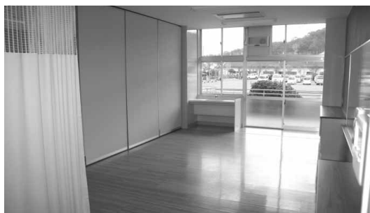
空調機器や洗面台が備わった支援教室

鴨川小学校内に、県立安房特別支援学校の「鴨川分教室」ができました。設置は県教育委員会が行いました。同委員会では、特別支援教育を受けている市内の子どもたちや保護者の負担を軽減しようと、小学校などの余裕教室を活用した分教室設置を検討してまいりました。