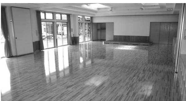
採光に配慮した明るい室内