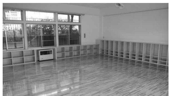
収納スペースたっぷりの保育室