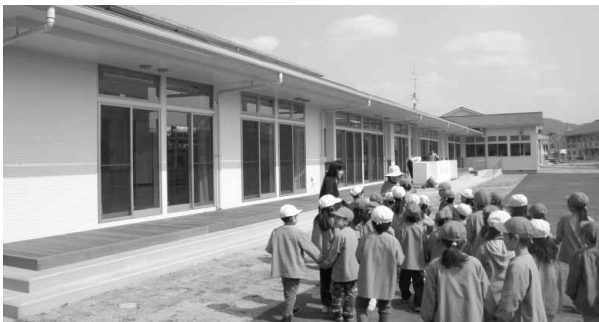
ガラス窓を多く取り入れた園舎

建物の前面には大きなガラス窓を多く取り入れるなど、採光に配慮したつくりになっています。こ