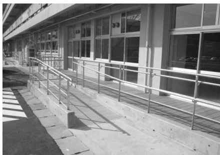
車イスに対応したスロープ

以上いることから、市教育委員会では鴨川小学校への分教室設置を県教育委員会に強く要望。4月1日（火）の施設オープンが実現したものです。 分教室は、小学校の1階部分に設置。支援教室6室とプレイルーム1室、職員室、トイレなどで構成されています。また、車イスでの移動ができるよう、昇降口などへスロープを取り付けたほか、スクールバス用に進入路も広げました。 施設の建築や電気設備などの事業費約7000万円