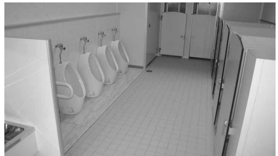
清潔で使いやすいトイレ

新幼稚園舎は、西条保育園に隣接する形で設置され、オーブン廊下を通じて行き来することができ、これら一体的に活用される2つの園舎の愛称は「西条こども園」。4月9日（水）には入園式が行われ、4・5歳児の幼稚園教育や預かり保育サービスなど、「幼保一元化」の拠点として、子育て世帯を支援していきます。