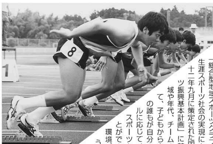
「総合型地域スポーツクラブ」構想とは、生涯スポーツ社会の実現に向けて平成十二年九月に策定された国の「スポーツ振興基本計画」に基づき、地域や年代、チームの枠を超えて、子どもから高齢者までの誰もが自分の技能レベルに応じて、あらゆるスポーツを楽しむことができるような環境づくりを行うものです。