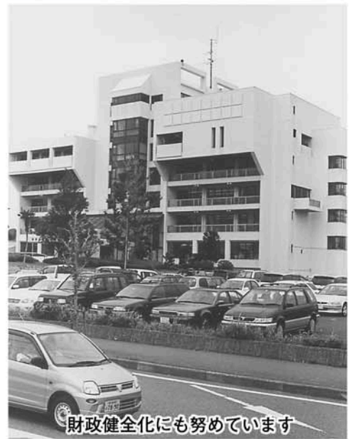
財政健全化にも努めています