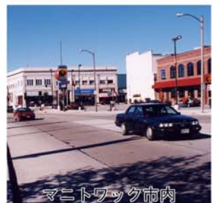
マニトワック市内