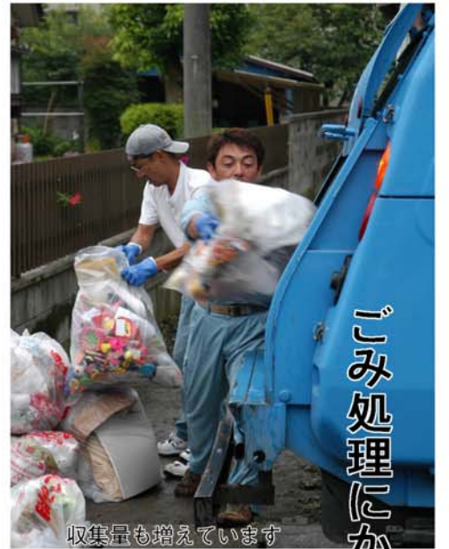
収集量も増えています

ごみとして捨てるモノを減らし、リサイクルを進めようと、私たちが平成11年10月から取り組んでいる指定袋を使った「ごみの10種類別」。この取り組みにより、その後は確かにごみが減りました。しかし最近では、再びごみの量が増えつつあるというデータも示され、ごみ処理や焼却施設の維持にかかる経費の負担も課題となってきています。