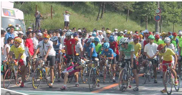
自転車競技(上)と ボクシング競技(下)