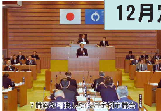
7議案を可決した12月定例会市議会