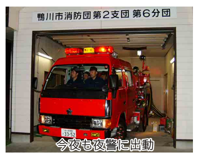
今夜も夜警に出勤

織の拡充に努めています。やはり、「もう少し地元にいる若い人たちの力が欲しい」というのが本音です。房総では一番寒い季節を迎えました。冬場は空気が乾燥し暖房器具等を多く使うため、一年で最も火災が発生しやすいシーズンです。この時期、市消防団では毎年、夜警巡視を実施しています。昨年十二月十五日から始まった夜警は、各分団が交代で二月下旬まで続けられます。しかし、何より防火をはじめとする防災活動は一部の人たちの力だけでは実を結びません。市民の皆さんの理解と協力があってこそできるものです。今夜も寒い中、夜警巡視に頑張る消防団員の皆さんを応援してください。