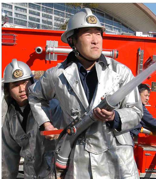
火災ゼロを願って放水（出初め式で）