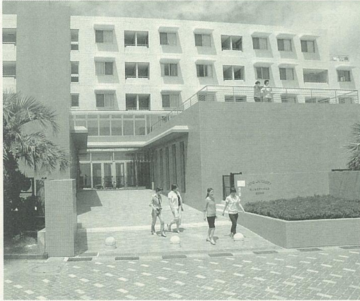
8月1日から学生などの受け入れを開始

●編集発行・鴨川市役所秘書課 広報広聴係 ●電話・0470(93)7827 ●FAX・0470(93)7850 ●鴨川市横渚1450 ●郵便番号・296-8601