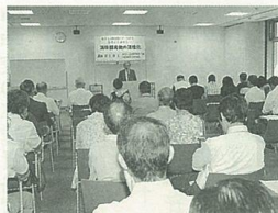
最大70人を収容するセミナーホール

することで日影の影響を最小限に抑えるなど、周辺環境にも配慮しています。建物の一、二階「学習・管理ゾーン」には最大七十人を収容するセミナーホールやゼミナール室最大七室、楽器演奏も可能な多目的室、談話室などがあります。