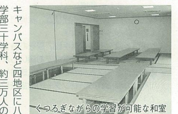
くつろぎながらの学習が可能な和室

することで日影の影響を最小限に抑えるなど、周辺環境にも配慮しています。建物の一、二階「学習・管理ゾーン」には最大七十人を収容するセミナーホールやゼミナール室最大七室、楽器演奏も可能な多目的室、談話室などがあります。