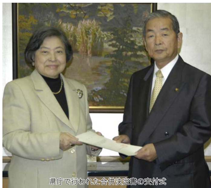
県庁で行われた合併決定書の交付式

鴨川市と天津小湊町の合併に関する議案が十月十二日(火)、県議会の最終日に可決されました。