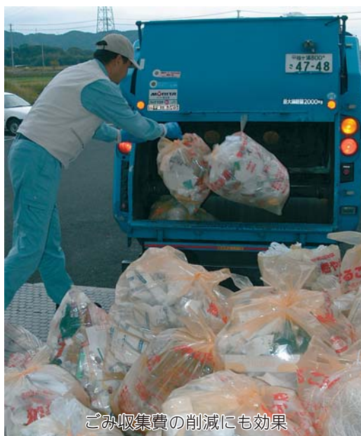
ごみ収集費の削減にも効果