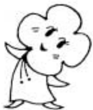
ねんきん ななちゃん

毎年7月は障害基礎年金を受けている人のうち、次の皆さんが現況届を提出する時期です。 20歳前に初診のある傷病により障害基礎年金を受けている人 障害福祉年金から移行した障害基礎年金を受けている人 該当する皆さんの現況届の用紙は先月下旬に受給者本人あてに送付されています。正しく記入し、町住民福祉課または小湊出張所へ7月31日までに提出してください。