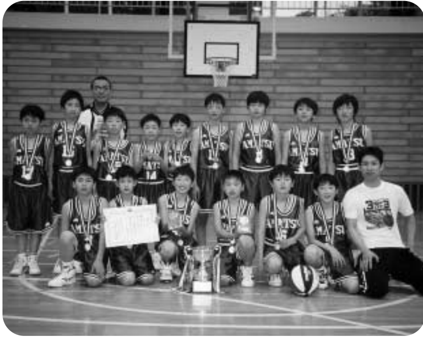
やったね！うれしい初優勝