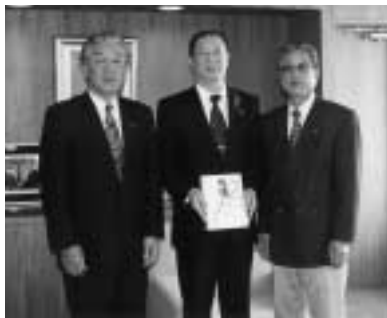
青少年育成のために...

鴨川市並びに本町の有志の皆さんが参加した、チャリティゴルフの表彰式が本町のホテルで開催された。 このなかで大会の主旨とあり、この大会の収益金を鴨川市と本町に後日ご寄付下さるのことで目録を頂いた。 町民の皆さんを代表し、深く謝意を伝えたところである。町広報誌の片隅に毎月のよ